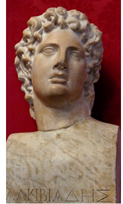
Alkibiades (İÖ 450-404) önde gelen bir Atinalı devlet adamı ve general idi.

Plutark'ın en iyi okuyucuları arasında Beethoven, Rousseau ve Shakespeare de bulunurken, Amerika Birleşik Devletleri'nin önde gelen kurucu babalarının tümü de Plutark'ın Yaşamlar 'ında büyük esin kaynağı buldular.