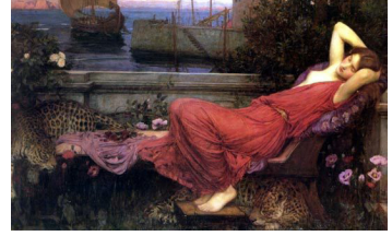
JOHN WILLIAM WATERHOUSE - ARIADNE (THESEUS TARAFINDAN TERKEDİLİYOR.)

İlk kez İtalyanca'ya çevrilen Yaşamlar 'ı Batı Avrupa Jacques Amyot'nun Fransızca çevirisi (1559) ile tanıdı. Thomas North'un İngilizce çevirisi (1579) Amyot'nun çevirisi üzerine dayanır. 1683'te John Dryden Yaşamlar 'ın Yunanca asıllarından yapılmasını sağladı. Almanca çeviri 1799-1806 yıllarında yayımlandı.